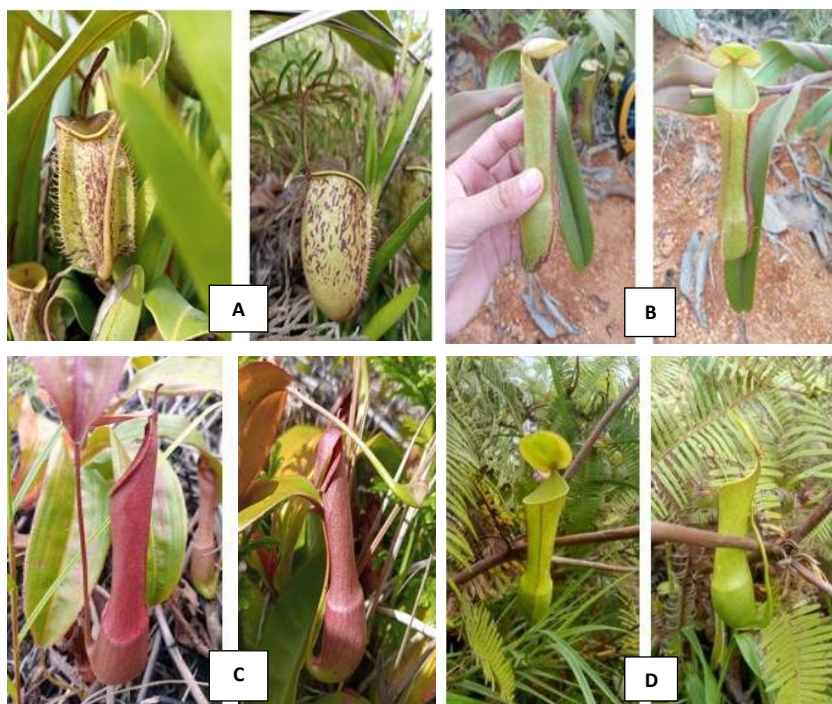
Gambar 2. Spesies Nepenthes di Subulussalam. (A) Nepenthes ampullaria ; (B) Nepenthes gracilis ; (C) Nepenthes mirabilis ; (D) Nepenthes reinwardtiana .

Penelitian berhasil mengidentifikasi berbagai jenis serangga yang terperangkap pada cairan kantong semar di lokasi penelitian. Spesies kantong semar yang diamati meliputi Nepenthes ampullaria , N. gracilis , N. mirabilis , dan N. reinwardtiana ( Gambar 2 ).