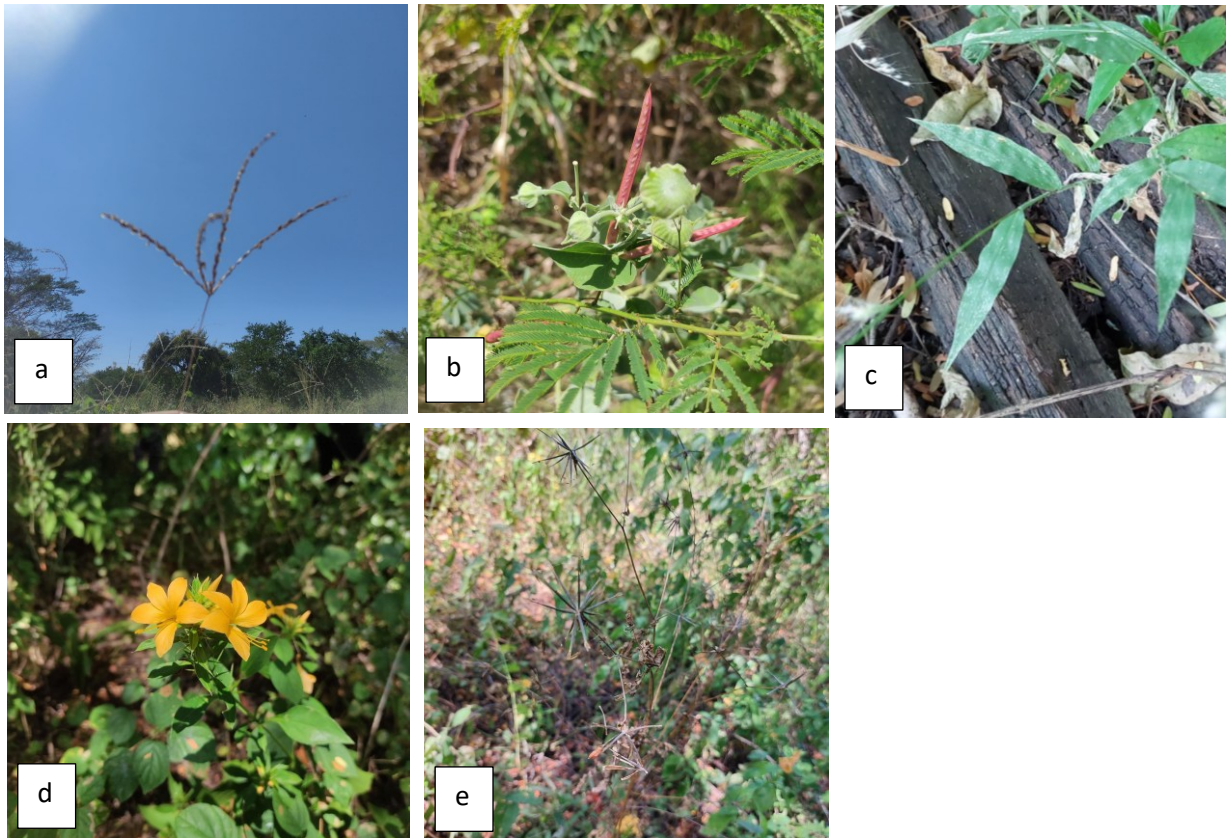
Gambar 2. (a) Digitaria ischaemum (Schreb.) Muhl.; (b) Desmanthus virgatus (L.) Willd.; (c) Oplismenus hirtellus (L.); (d) Barleria prionitis L.; dan (e) Bidens subalternans DC.

Oreja et al., (2019) menyatakan bahwa Digitaria sanguinalis (L.) Scop. adalah tumbuhan gulma tahunan yang mengganggu dan menyebabkan hilangnya hasil panen berbagai tanaman. Perannya sebagai tumbuhan invasif asing, Digitaria sanguinalis (L.) Scop dapat membuat kawasan habitatnya menjadi hamparan padang rumput sehingga tidak dapat memberikan kesempatan tumbuhan lain untuk hidup subur di sekitarnya, dan dapat menularkan hama dan penyakit untuk tanaman yang ada di sekitarnya (Hasanah & Murti Laksono, 2018). Contoh spesies disajikan pada Gambar 2 .