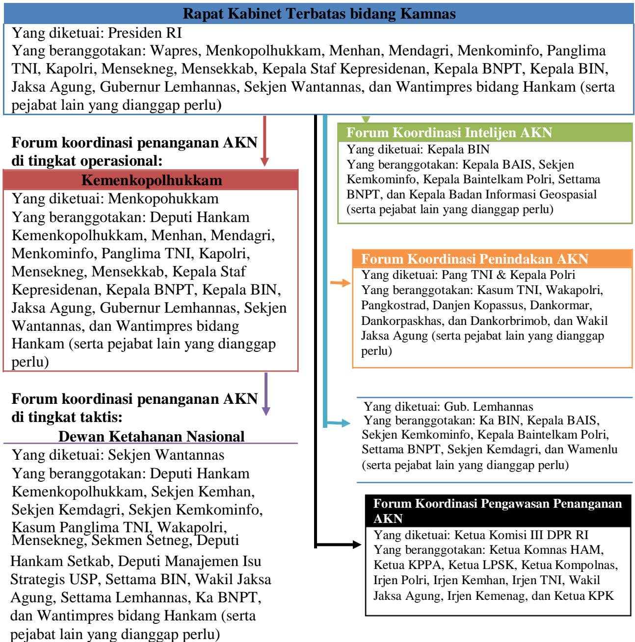
Gambar 2. Forum Koordinasi Penanganan Keamanan Nasional di Tingkat Strategis