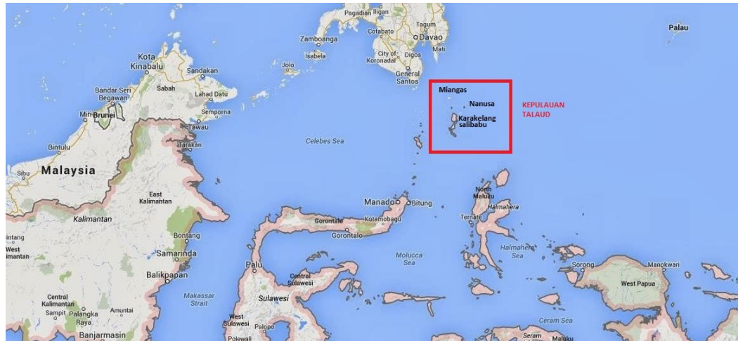
Gambar 1.2 Lokasi Penelitian

Data terkait interaksi antar aktor yang terkait di dalam illegal fishing diperoleh melalui wawancara mendalam, dengan panduan wawancara yang telah dipersiapkan sebelumnya. Pengumpulan data primer ini berkaitan dengan gagasan, pemikiran, pengetahuan, tindakan dan interaksi masyarakat perbatasan di dalam kegiatan illegal fishing dikumpulkan dari informan kunci yang memang secara nyata aktif terlibat. Penetapan informan kunci berdasarkan informasi dari narasumber dengan cara “snowball”. Subjek yang diwawancarai antara lain: