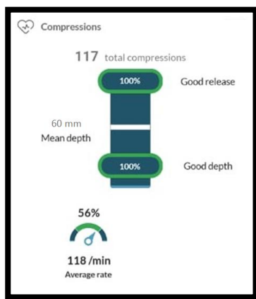
Gambar 1. Skor Rata-Rata Frekuensi dan Kedalaman Kompresi

Berdasarkan tabel diatas mayoritas kedalaman kompresi responden 5-6 cm sebanyak 87,5%.