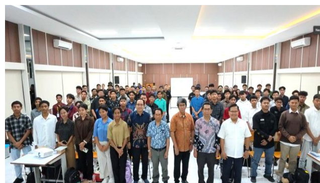
Gambar 4. Foto bersama tim dan peserta PKM