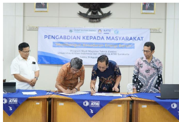
Gambar 1. Penandatanganan dokumen Implementation Arrangement (IA)

Kegiatan PKM bertema Membangun Kesadaran Energi Bersih di Politeknik ATMI Surakarta memiliki keterkaitan langsung dengan Tujuan Pembangunan Berkelanjutan (SDG) 7, yaitu memastikan akses terhadap energi yang terjangkau, andal, berkelanjutan, dan modern untuk semua. Melalui pendekatan edukatif, pelatihan tematik, dan peningkatan literasi energi bersih, program ini berkontribusi terhadap pencapaian indikator SDG 7 seperti peningkatan pemahaman masyarakat terhadap sumber energi terbarukan, efisiensi energi, dan potensi implementasi teknologi ramah lingkungan. Selain membangun kesadaran, kegiatan ini juga mendorong transformasi budaya akademik menuju praktik operasional yang lebih berkelanjutan, serta membuka peluang kolaborasi lintas sektor dalam mendukung transisi energi di tingkat lokal. Dengan demikian, PKM ini tidak hanya berdampak pada peningkatan pengetahuan, tetapi juga memperkuat peran institusi pendidikan vokasi dalam mendukung agenda global pembangunan berkelanjutan.