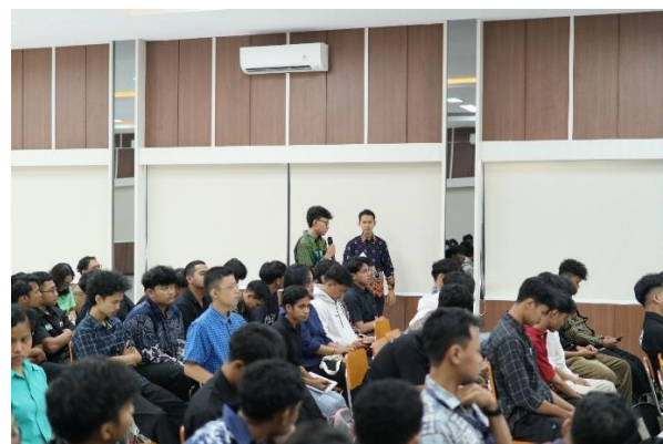
Gambar 3. Partisipasi aktif peserta PKM