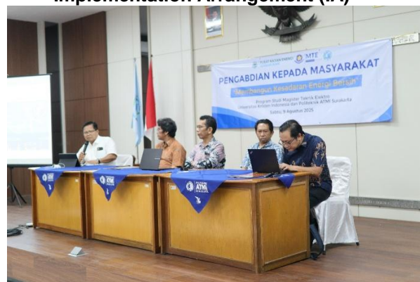
Gambar 2. Pelaksanaan PKM