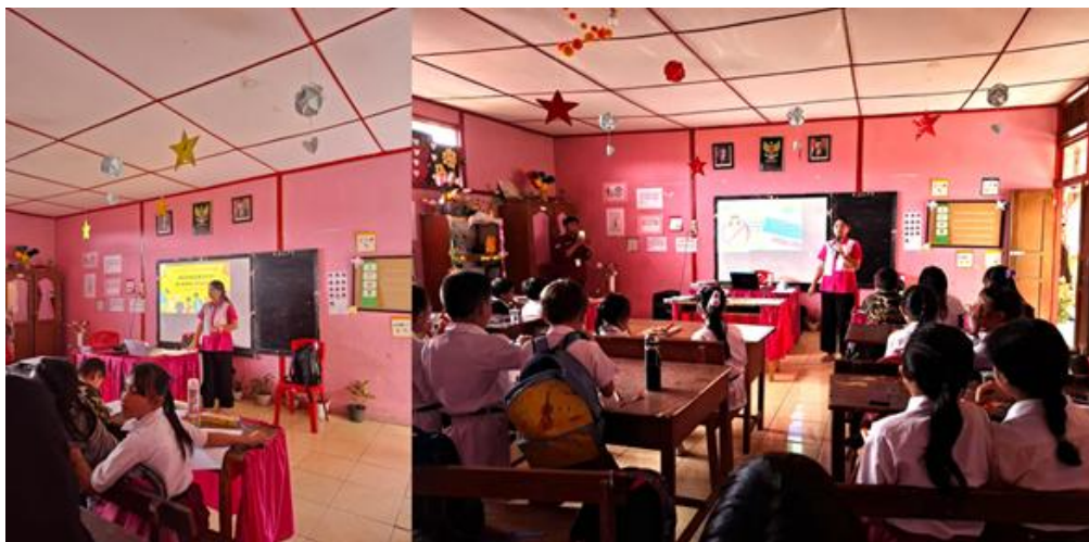
Gambar 4. Penyuluhan dan Edukasi Pencegahan Kekerasan Seksual di SDN 1 Tataaran 1