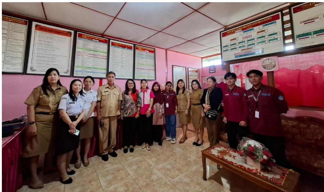
Gambar 11. Photo Bersama Kepala sekolah, Bapak/ Ibu Guru SD Negeri 1 Tataaran 1, mahasiswa dan Tim PkM