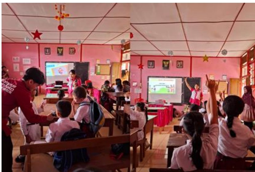
Gambar 5. Diskusi dan Tanya Jawab dengan Siswa/i Pencegahan Kekerasan Seksual

siswa/i setelah dilakukan sosialisasi dan pengenalan dini akan seksual dalam lingkungan sekitar mereka, sekolah dan keluarga. Gambar 5. menunjukkan antusias dari setiap siswa/ i yang ingin bertanya akan materi yang telah dipaparkan.