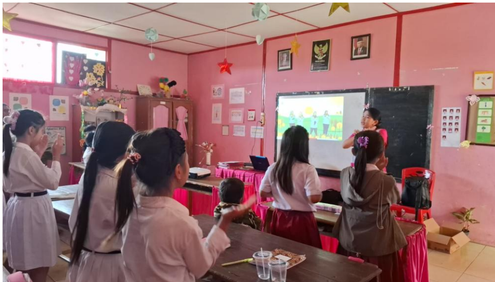
Gambar 6. Kegiatan Refleksi dengan Siswa/ i setelah dilakukan Sosialisasi dan Edukasi akan Pencegahan Kekerasan Seksual

begitu menikmati kegiatan yang dilakukan.