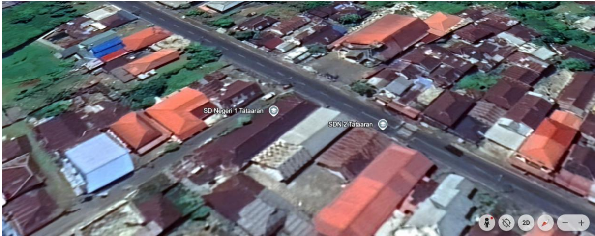
Gambar 3. Peta Letak SD Negeri 1 Tataaran 1