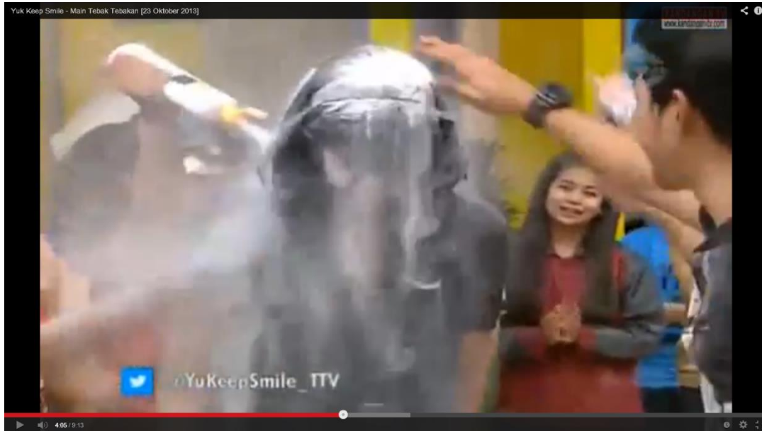
Gambar 4: Yuk Keep Smile