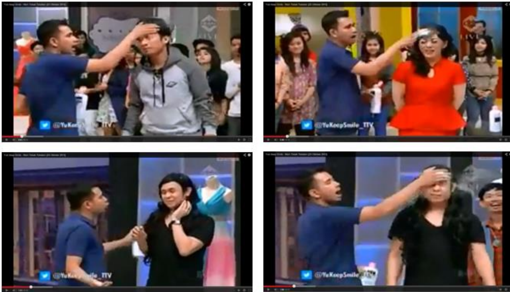
Gambar 3: Yuk Keep Smile