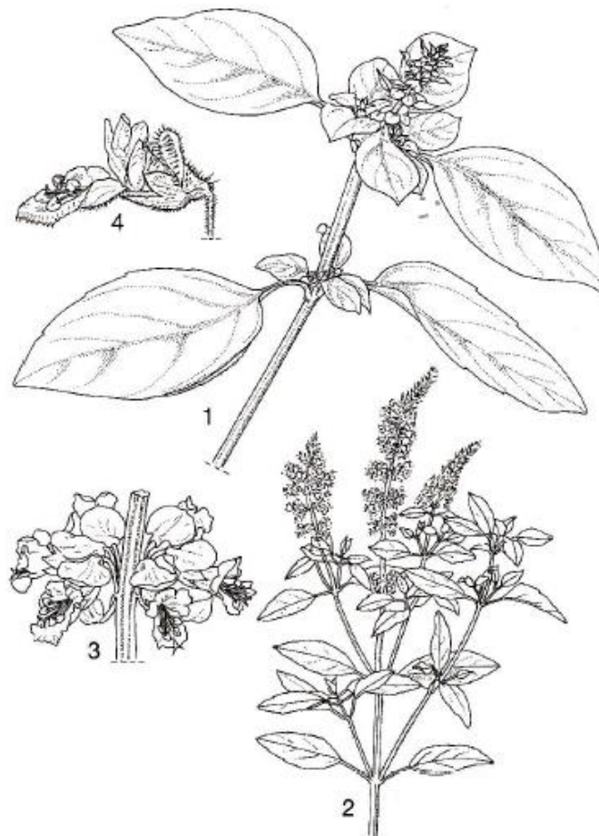
Gambar 1. Ocimum basilicum L. (1). bunga; (2) taruk ( shoot ); (3). pembungaan (4) flouter (de Guzman dan Simeonsma, 1999).

Bunga O. basilicum memiliki labiate (bibir) berwarna putih, merah muda ( rose ) hingga ungu ( violet ). Kalik (kelopak bunga) berbentuk bilabiate dan corolla (mahkota bunga) memiliki 4 lobus (Moghaddam et al. , 2011). Bibir bagian bawah sederhana dengan 4 stamen berbaring di dalamnya (Sajjadi, 2006) (Gambar 1).