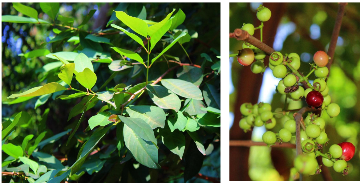
Gambar 6. Daun salam atau Syzygium polianthum . Kiri. Ranting dengan daun; Kanan Buah yang berbagai tingkat kematangan

hal tersebut berhubungan dengan sumber perolehan yang melimpah.