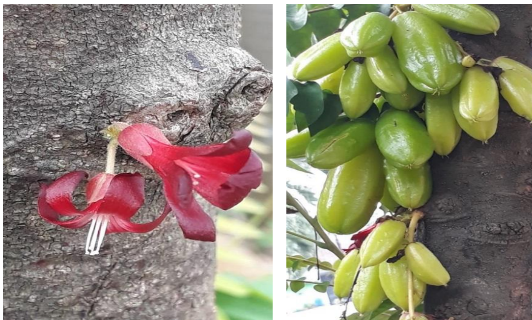
Gambar 5. Belimbing wuluh atau Averrhoa bilimbi L. Kiri. Bunga berwarna merah sedang mekar; Kanan. Buah dengan berbagai tingkat kematangan

digunakan untuk mengatasi berbagai penyakit seperti, batuk, masuk angin, gatal-gatal, bisul, rematik, sifilis, kencing manis, batuk rejan, (Chowdhury et al 2012) dan kanker (Ali et al 2013). Walaupun A. bilimbi banyak dimanfaatkan sebagai obat tradisional namun Sa et al (2019) menyatakan sebagian species dari Oxalidaceae mengandung senyawa kristal kalsium oksalat sehingga konsumsi yang berlebihan dapat mengurangi fungsi ginjal. Hal senada juga dilaporkan oleh Arya Mohan et al (2016), bahwa penggunaan jus buah A. bilimbi dalam konsentrasi yang tinggi dapat mengakibatkan gagal ginjal akut karena kandungan oksalat tinggi dapat berimplikasi pada deposisi kristal oksalat intratubular.