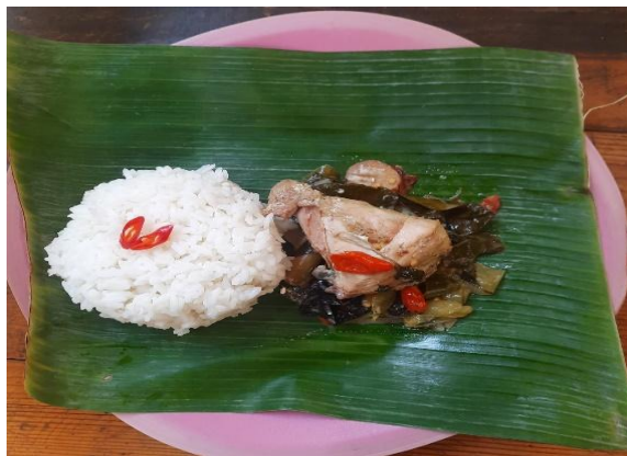
Gambar 4. Bumbu Ayam garang asem disajikan bersama nasi dan siap dikonsumsi

Responden menyatakan bahwa ayam garang asem termasuk dalam makanan mewah bagi masyarakat di Desa Dimoro, sehingga biasanya dikonsumsi pada saat hari raya besar atau dikonsumsi oleh warga yang relatif memiliki kemampuan ekonomi baik. Pemilihan daging ayam sebagai bahan utamanya karena ayam banyak dibudidayakan oleh masyarakat di Desa Dimoro. Penggunaan ayam berhubungan dengan pasokan ikan di desa tersebut sangat terbatas karena Desa Dimoro jauh dari laut dan danau sehingga harga ikan bisa lebih mahal dibandingkan dengan harga daging ayam. Bagi masyarakat suku Jawa di Desa