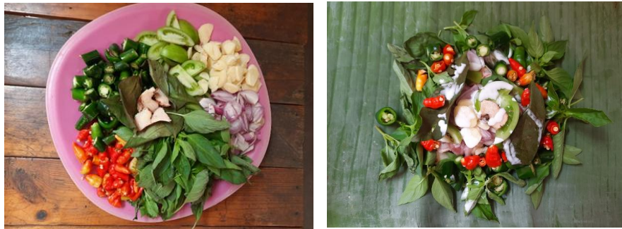
Gambar 3. Kiri. Bumbu telah yang telah diiris, dipotong-potong; Kanan. Bumbu Ayam garang asem disajikan bersama nasi dan siap dikonsumsi