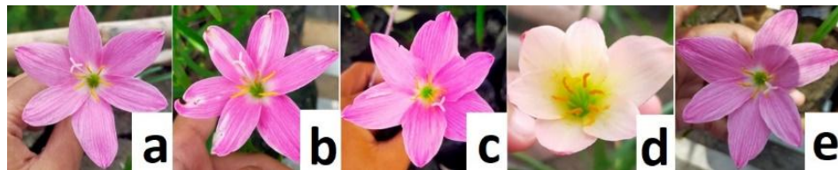
Gambar 1 Pengaruh konsentrasi kolkisin terhadap warna bunga Z. rosea Lindl. a= konsentrasi kolkisin 0 %, b= konsentrasi kolkisin 0,025 %, c= konsentrasi kolkisin 0,05 %, d= konsentrasi kolkisin 0,075 %, e= konsentrasi kolkisin 0,1 %.

tersebut disebabkan banyak parameter yang tidak terpengaruhi secara signifikan. Hal tersebut sesuai dengan Husband et. al. (2016) dan Parjanto (2017) bahwa tidak terinduksi Chamerion angustifolium dan sirsak ( Annona muricata ) poliploid akibat paparan kolkisin.