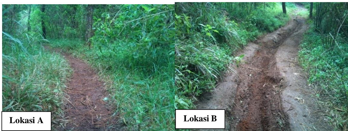
Gambar 1. Lokasi Penelitian(Lokasi A : area datar, dan Lokasi B : area miring)