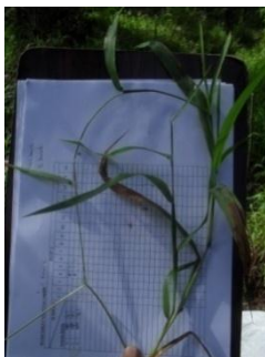
Paspalum conjugatum Berg.