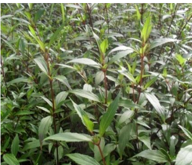
Eupatorium riparium Regel.