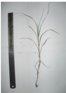
Cynodon dactylon (L.)Pers.

Keterangan : X = area jalur lintasan Y = area tepi jalur lintasan Z = area yang tidak terganggu