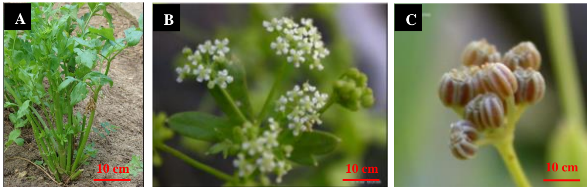
Gambar 1. Habitus seledri ( Apium graveolens L.) berupa herba menahun (A); Susunan perbungaan bertipe payung (B); Buah (C)