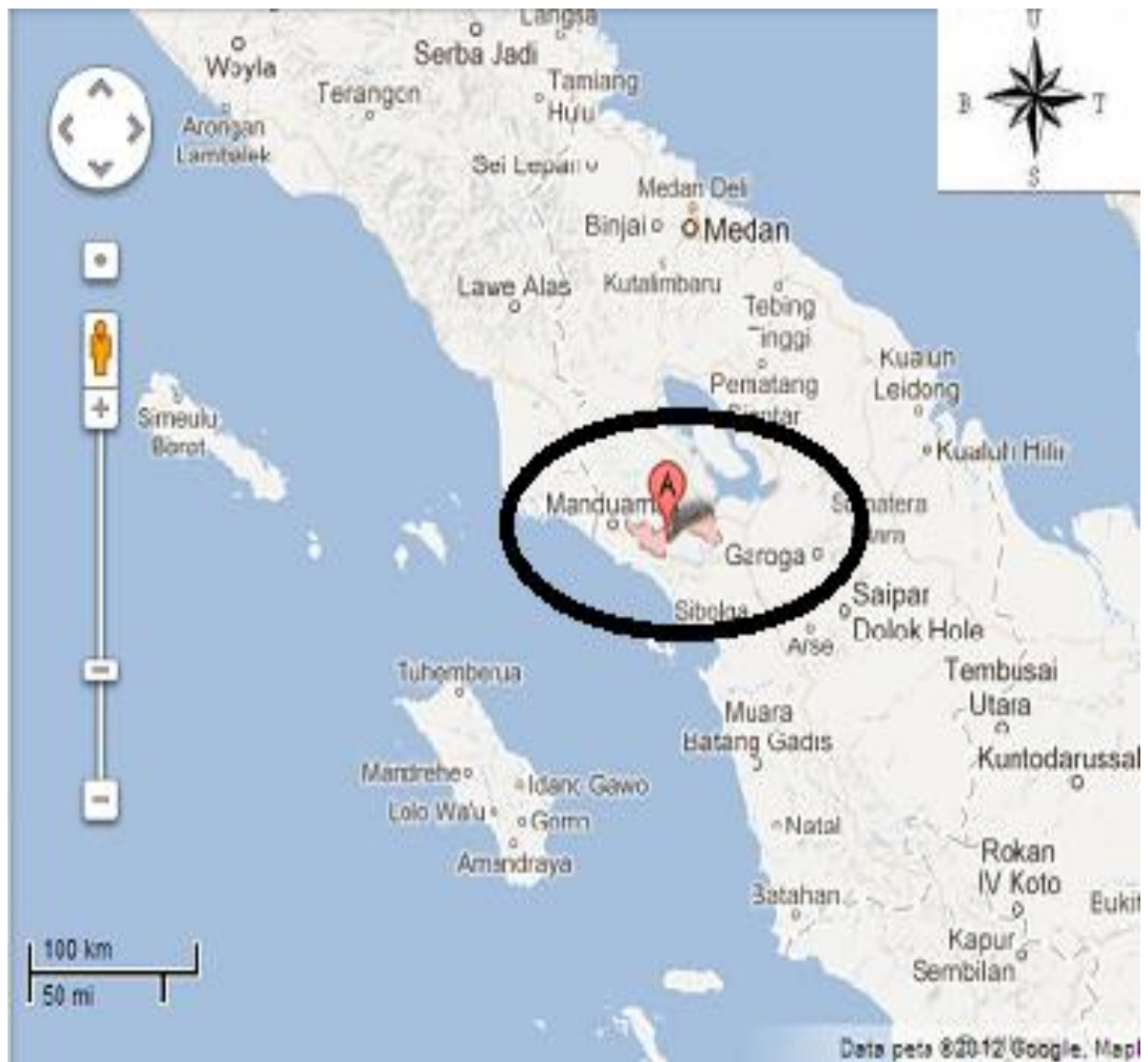
Gambar 1: Lokasi Penelitian Studi Etnobotani di Desa Peadungdung, Sumatera Utara

dilakukan di lapangan saat mengumpulkan voucher specimen tumbuhan yang digunakan oleh masyarakat Desa Peadungdung (Martin, 1995). Selanjutnya, voucher specimen diidentifikasi di Herbarium Bogoriense, LIPI, Cibinong. Tumbuhan yang digunakan oleh masyarakat lokal di Desa Peadungdung dianalisis dengan mengelompokkan berdasarkan kategori guna. Data dianalisis dengan menggunakan statistika deskriptif.