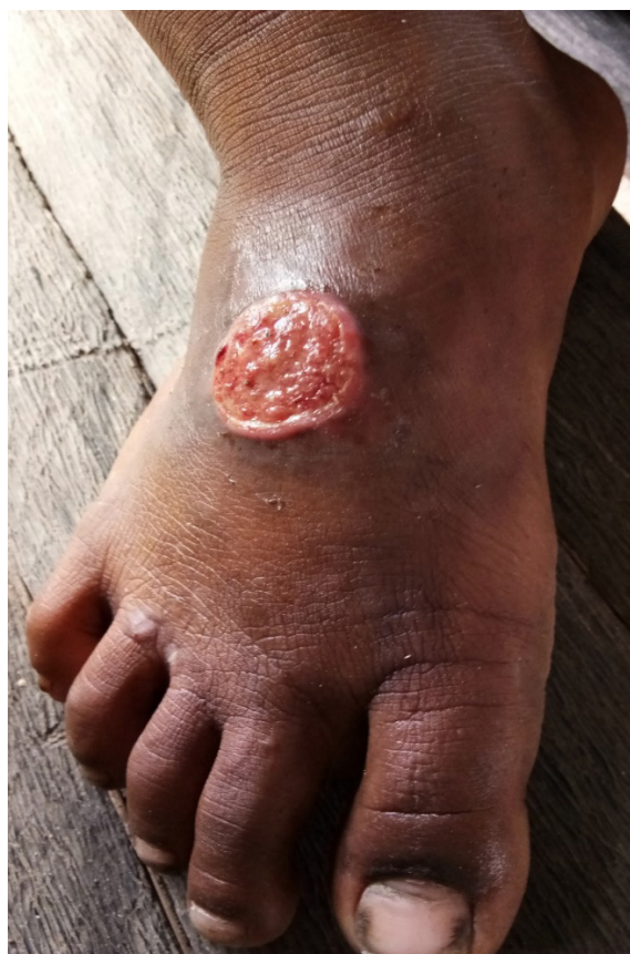
Gambar 1. Lesi primer frambusia pada kaki berupa ulkus dangkal yang basah

Frambusia memiliki beberapa stadium penyakit yang secara umum melibatkan kulit, tulang, dan jaringan lunak. Pada stadium awal atau lesi primer didapatkan lesi eritematosa berupa papul di sisi inokulasi setelah periode inkubasi 9-90 hari. 1-3 Lesi tersebut berkembang menjadi luka atau ulkus basah dalam waktu 1-2 minggu (Gambar 1). Lesi primer paling sering didapatkan pada tungkai bawah atau bokong. Jika pada stadium primer pasien tidak diberikan terapi, lesi akan sembuh dengan sendirinya dengan meninggalkan bekas luka dalam waktu 3-6 bulan. 1,2,5