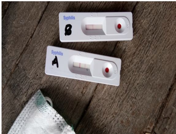
Gambar 2. Pemeriksaan Frambusia menggunakan Rapid Diagnostic Treponema-Test (RDT-T).

itu, jika didapatkan hasil RDT positif pada anak usia 1-5 tahun, sebaiknya diperiksa kembali dengan pemeriksaan non treponema rapid plasma reagin (RPR) test untuk menilai apakah transmisi masih berlangsung. 10,11