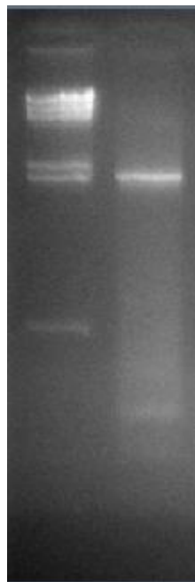
Gambar 1. Hasil elektroforesis amplifikasi gen NS3 dengan teknik PCR Lajur 1. Marka DNA \lambda Hind III; Lajur 2. Gen NS3

Hasil transformasi yang telah diinkubasi selama 16 jam menunjukkan pertumbuhan bakteri E. coli DH5 \alpha pada hasil ligasi sebanyak 250 koloni. Selanjutnya dilakukan isolasi plasmid sebanyak 24 koloni yang dipilih secara acak dari 250 koloni yang tumbuh. Berdasarkan visualisasi hasil isolasi dapat terlihat adanya perbedaan pola migrasi 4 pita DNA rekombinan.