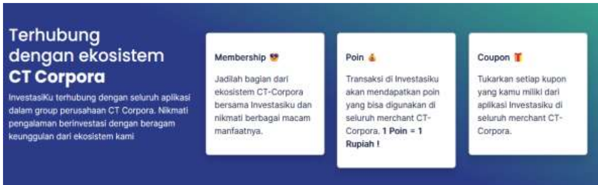
Gambar 1. Contoh strategi InvestasiKu

Berdasarkan gambar 1. di atas, InvestasiKu telah melakukan berbagai upaya strategi pemasaran untuk meningkatkan minat investasi. Apabila ditinjau dari marketing mix , dari segi produk InvestasiKu telah terintegrasi terhadap semua aplikasi di dalam ruang lingkup perusahaan CT Corp. Dari segi harga InvestasiKu menawarkan fee transaksi yang cukup rendah. Dari segi tempat, saat ini InvestasiKu juga dapat diakses dengan CNBC Indonesia sehingga dengan membaca berita langsung dapat membeli saham sehingga konsumen dapat mengakses aplikasi InvestasiKu diberbagai platform lainnya. Adapun dari segi promosi, InvestasiKu melakukan beberapa event goes to campus untuk mendapatkan pasar generasi muda.