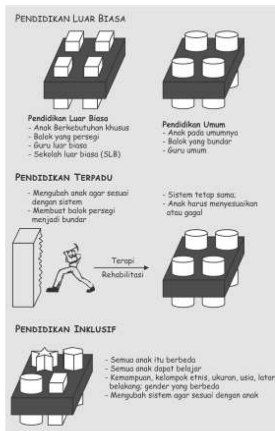
Gambar 1. Ilustrasi pendidikan luar biasa, pendidikan terpadu dan pendidikan inklusif.

“An inclusive setting is defined as the meaningful participation of students with disabilities in the general education classroom”