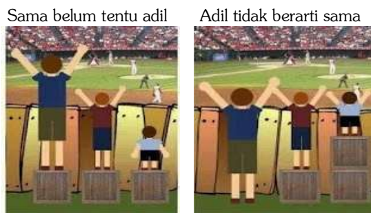
Gambar 2. Ilustrasi adil dan sama.

Karena sama belum tentu adil dan adil tidak berarti sama. Jadi kesempatan belajar di kelas reguler bagi ABK saja tidak cukup. Perlu diperhatikan lebih lanjut apakah ABK tersebut membutuhkan hal lain (yang mungkin tidak dibutuhkan oleh siswa reguler) sehingga pembelajaran yang dilakukannya bisa sesuai dengan profil kemampuannya, bermakna dan merespon pembelajaran yang dibutuhkan olehnya. Sebagai ilustrasi adalah gambar 2.