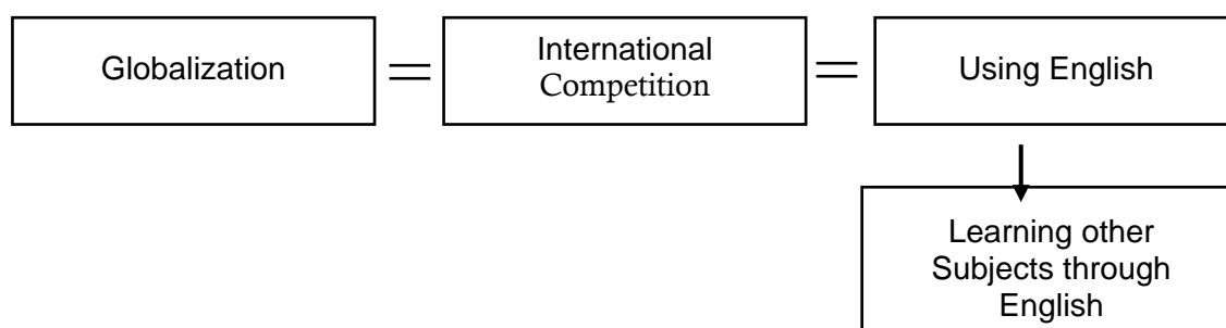
Gambar 2. Persepsi hubungan antara globalisasi dengan factor-faktor lain terkait dengan pentingnya Bahasa Inggris (Coleman, 2011).

Peran penting bahasa Inggris sebagai media pengajaran di Indonesia sering kali dikaitkan dengan 'globalisasi' dan 'kompetisi' (Coleman, 2011). Asumsinya adalah bahwa globalisasi identik dengan kompetisi internasional; kompetisi internasional pada gilirannya dianggap melibatkan penggunaan bahasa Inggris; dan menggunakan bahasa Inggris tampaknya mengharuskan pembelajaran mata pelajaran lain melalui bahasa Inggris (Coleman, 2011). Gambar 2 menggambarkan korelasi antara globalisasi dan pembelajaran bahasa Inggris di Indonesia.