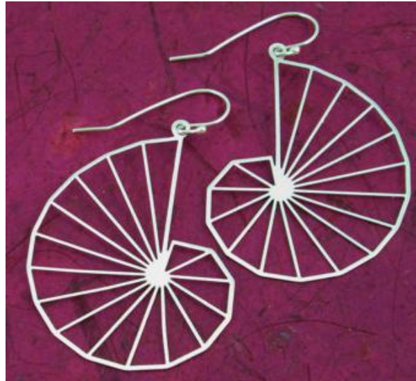
Gambar 2. Anting Spiral Theodorus

hal yang memiliki kemiripan bentuk dengan Spiral Theodorus .