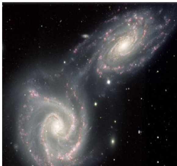
Gambar 5. Colliding Galaxies mirip dengan Spiral Theodorus

kemiripan dengan Spiral Theodorus . Hal ini dapat dilihat dari gambar berikut: