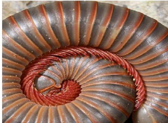
Gambar 4. Ruas Tubuh Diplopoda yang mirip dengan Spiral Theodorus

kemiripan dengan Spiral Theodorus . Terlihat dari gambar berikut: