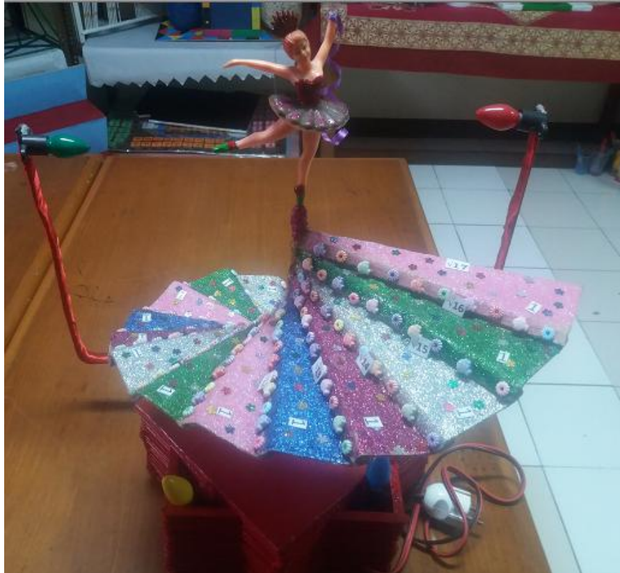
Gambar 8. Kotak Musik Kedua Spiral Theodorus Karya Mahasiswa Semester 1 Prodi Pendidikan Matematika Universitas Kristen Indonesia (UKI)

Konsep yang terdapat pada kotak musik yang pertama sama dengan konsep pada kotak musik yang kedua. Keduanya sama-sama memperkenalkan teorema Pythagoras dengan kotak musik Spiral Theodorus . Kotak musik yang pertama memiliki tema yang berbeda dengan tema kotak musik yang kedua. Kotak musik pertama mengandung tema lampu yang dapat digantung dirumah, dipohon. Kotak