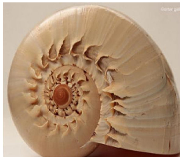
Gambar 3. Rumah siput yang mirip dengan Spiral Theodorus

yang memiliki bentuk yang mirip dengan Spiral Theodorus . Rumah siput merupakan contoh pertama yang memiliki kemiripan dengan bentuk Spiral Theodorus . Hal ini dapat dilihat dari gambar berikut: