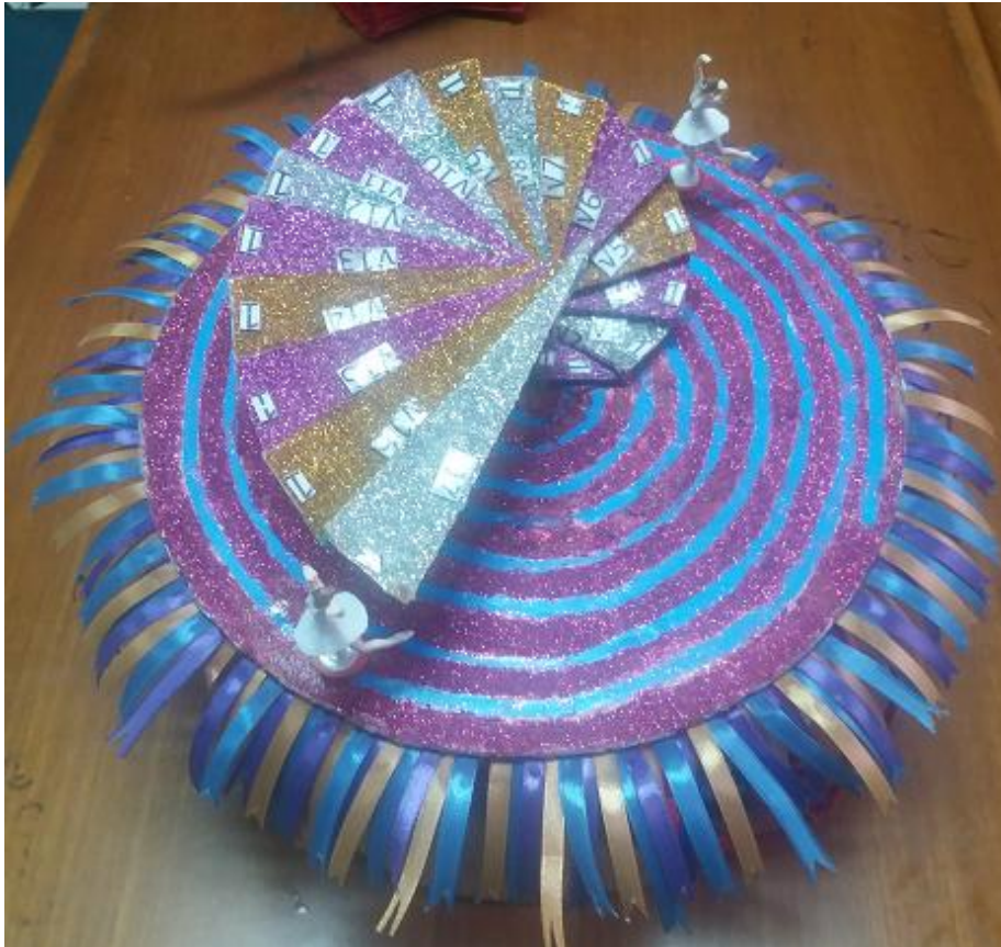
Gambar 9. Kotak Musik Ketiga Spiral Theodorus Karya Mahasiswa Semester 1 Prodi Pendidikan Matematika Universitas Kristen Indonesia (UKI)

Kotak musik yang ketiga memiliki tema yang sama dengan kotak musik yang kedua yaitu Barbie , namun demikian bentuknya berbeda dengan kotak musik yang kedua. Masing-masing kotak musik memiliki keunikan masing-masing baik dari bentuk, warna, tema. Hal ini semata-mata dilakukan untuk membuat kotak musik yang bervariasi, sehingga dapat menarik perhatian siswa sekolah untuk menggunakan kotak musik Spiral Theodorus untuk mengingat teorema Pythagoras .