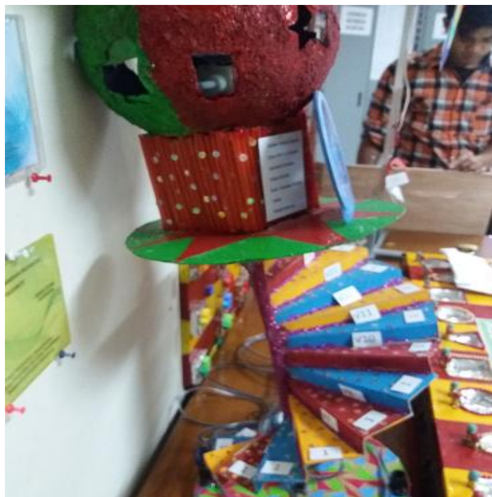
Gambar 7. Kotak Musik Pertama Spiral Theodorus Karya Mahasiswa Semester 1 Prodi Pendidikan Matematika Universitas Kristen Indonesia (UKI)

membuat kotak musik Spiral Theodorus . Kotak musik ini diharapkan dapat meningkatkan pemahaman siswa untuk teorema Pythagoras .