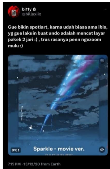
Gambar 3: Pengungkapan diri menggunakan Video di X

Pada gambar 2 merupakan tangkapan layar dari akun pseudonim di X @hecallmepiki. Pada gambar tersebut adalah aktivitas pengungkapan diri yang dilakukan oleh akun pseudonim @hecallmepiki di X yang memperlihatkan pengguna tersebut melakukan pengungkapan diri dengan membagi ceritanya menggunakan gambar lalu menambahkan teks pada unggahannya.