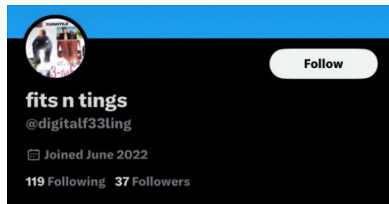
Gambar 1: Akun X yang Mencirikan Akun Pseudonim

X yang dulunya lebih sering dikenal dengan nama Twitter, merupakan media sosial yang cukup dikenal di kalangan masyarakat. X memiliki peran yang besar apabila disatukan terhadap pengalaman komunikasi penggunaannya dalam kehidupan sehari-hari. X merupakan media sosial yang mempunyai sifat terbuka yang berarti siapa saja bisa mendapat informasi melalui X. Karena hal tersebut, pengguna X kerap memanfaatkan X sebagai pemuas keinginan mereka dalam berinteraksi dan bertukar informasi secara cepat, luas dan bebas. Jika dilihat dari aturan dan ketentuan yang diberikan oleh X, pengguna X memiliki hak penuh dalam mengubah informasi dan data secara bebas pada akun yang dimiliki (Supratman, 2018).