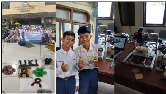
Gambar 1. Dokumentasi Kegiatan Sosialisasi Pemanfaatan Molding Lilin Aromaterapi Karakter

Kegiatan sosialisasi pemanfaatan molding lilin aromaterapi karakter dilaksanakan di SLB B-C Bina Karya Insani, Pondok Bambu, Jakarta Timur. Peserta PkM berjumlah 25 orang yang terdiri dari tenaga pendidik dan tenaga kependidikan sebanyak 8 orang dan siswa ABK sebanyak 17 orang. Kegiatan tersebut dimaksudkan sebagai upaya stimulator kegiatan berwirausaha ABK dimana lilin aromaterapi karakter sebagai salah satu opsi yang dapat dikembangkan menjadi produk bernilai ekonomis yang layak dipasarkan pada platform-platform digital.