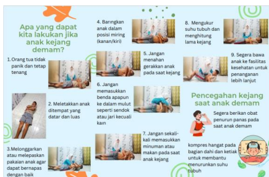
Gambar 1. Media Leaflet