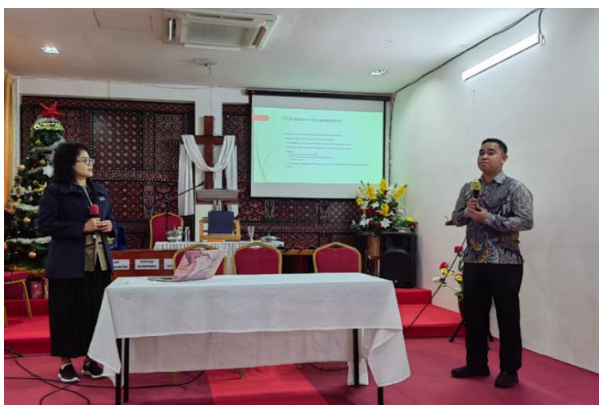
Gambar 4. Pembinaan Manajemen Keuangan Gereja

Selain itu, gereja juga perlu membantu jemaat untuk meningkatkan keterampilannya, dengan mengundang para nara sumber dari luar. Dengan peningkatan keterampilan, diharapkan jemaat dapat meningkatkan pendapatannya.