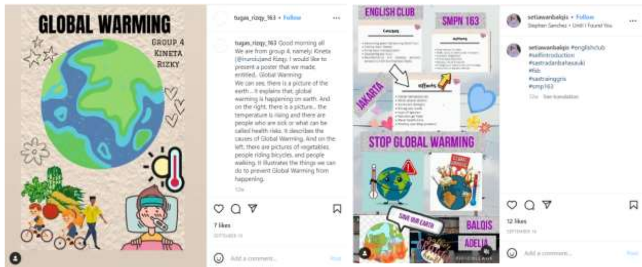
Gambar 1. Unggahan Poster Penugasan Global Warming (Sesi II)

Dari gambar 1 di atas, kedua sampel poster di atas menunjukkan gambaran kemampuan teknis dan non teknis siswa/l peserta English Club . Dari gambar 1a (sebelah kiri), sampel penugasan kelas C, terlihat kelompok Kineta dan Rizky mengaplikasikan pemahaman mereka terhadap Global Warming melalui poster kampanye Global Warming yang menggunakan pilihan gambar kreatif yang menyuarakan dampak dan upaya pencegahan yang dapat dilakukan. Kemudian mereka menjelaskannya dalam bentuk caption panjang berbahasa Inggris agar para pengikut Instagram mereka dapat memahami makna gambar tersebut. Dari gambar 1b (sebelah kanan), sampel penugasan kelas A, terlihat kelompok