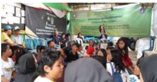
Gambar 4. Workshop dan Pelatihan

Tujuan dari kegiatan ini adalah memberikan program khusus dimana anak-anak sekolah juga sudah wajib ikut memelihara kebersihan dan kesehatan lingkungan dari sampah. Diperkenalkan cara dan teknik pengelolaan sampah hingga memanfaatkannya untuk daur ulang menjadi benda yang berguna dan berharga. Hal ini merupakan bagian dari program Kelurahan Kebon Pala menuju kampung Proklamasi dimana seluruh masyarakatnya sejak usia dini diperkenalkan untuk peduli kepada pengelolaan lingkungan yang bebas dari sampah/ limbah. Dalam Workshop dan Pelatihan ini diperkenalkan berbagai jenis sampah lingkungan dan pengelolaannya, kemudian menunjukkan berbagai olahan sampah menjadi berharga. Workshop dan pelatihan mengajak anak-anak sekolah berkreasi dengan sampah menjadi karya seni dan kerajinan. Dalam workshop dan pelatihan tersebut juga diberikan pembekalan materi lomba tentang Kreativitas Karya Seni & Kerajinan Dari Material Daur Ulang / Limbah Untuk Siswa SD & SMP. Sebagai tindak lanjut dari kegiatan ini adalah diadakannya lomba tentang Kreativitas Karya Seni & Kerajinan Dari Material Daur Ulang/Limbah Untuk Siswa SD & SMP.