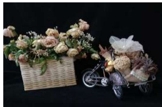
Gambar 3. Kerajinan Daun Transparan