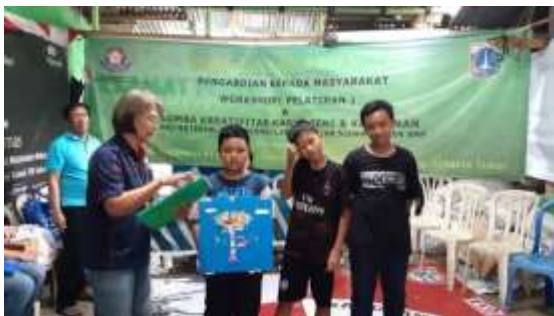
Gambar 7. Pemenang Lomba Kreativitas Karya Seni & Kerajinan