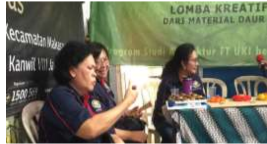
Gambar 5. Tim pengabdian Masyarakat