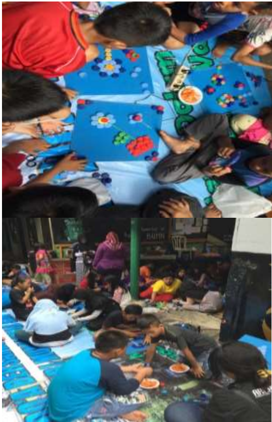
Gambar 6. Pelaksanaan Lomba Kreativitas Karya Seni & Kerajinan