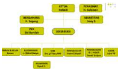
Gambar 2. Struktur Kepengurusan Rukun Tetangga RT 09 RW 09

terlihat bahwa 47,95% penduduk RT 09 RW 09 Kelurahan kebon Pala bekerja sebagai pegawai swasta, sementara yang bekerja sebagai pegawai negeri sipil ada 13,70%, pensiunan ada 08.22%, pedagang 04,11%, dan pekerjaan lain 26,02%. Struktur Kepengurusan Rukun Tetangga RT 09 RW 09 Kelurahan Kebon Pala dapat dilihat pada gambar berikut: