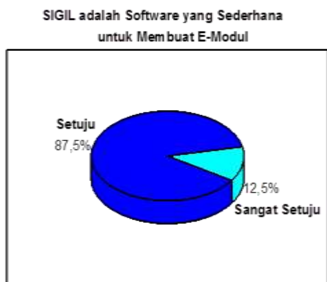
Gambar 2 Diagram kepuasan partisipan terhadap kemudahan (kesederhanaan) software SIGIL dalam pembuatan e-modul

Kepuasan partisipan terhadap software SIGIL dalam pelatihan menunjukkan hanya 12,5% partisipan yang sangat setuju bahwa SIGI dapat digunakan dengan sederhana (Gambar 2). Hal ini menggambarkan bahwa penggunaan SIGIL dalam memproduksi e-modul menemukan kesulitan dalam pelatihan, yaitu dalam menggunakan software ini masih diperlukan sedikit modifikasi dalam koding yang dipakai Software SIGIL memiliki dua bahasa dalam pengoperasiannya, yaitu tampilan biasa (tampilan web) dan tampilan dalam bentuk koding. Penggunaan koding (sebagaimana telah dibahas didalam modul penuntun pembuatan) dipakai dalam