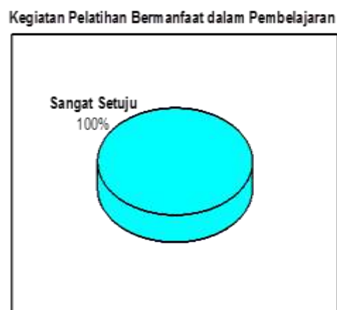
Gambar 1 Diagram kepuasan partisipan terhadap kebermanfaatan pelatihan terhadap pembelajaran

format e-book adalah pdf; dan 10,50% mengira bahwa format e-book adalah doc, xls dan ppt.