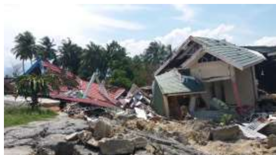
Gambar 8. Liquefaksi yang menunggangbalikkan rumah-rumah