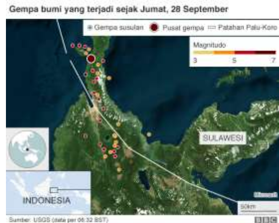
Gambar 5. Sesar Palu Koro

2018). Dalam periode 2009-2015 gempa terdalam yang berkaitan dengan Sesar Matano adalah 50 km dan untuk Sesar Palu Koro adalah 40 km (Pusat Studi Gempa Nasional, 2017).