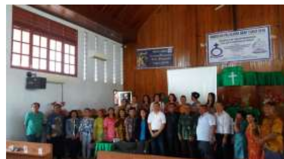
Gambar 3. Foto bersama jemaat HKBP Palu