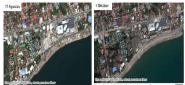
Gambar 14. Palu Sebelum dan Setelah Tsunami

Kerusakan akibat tsunami terutama adalah karena gaya dorong dan gaya tarik dari gelombang air yang masuk ke daratan bersamaan dengan material debris yang dibawanya mengapung berupa massa yang besar sehingga terjadi tumbukan yang memberikan dampak kerusakan yang sangat besar. Erosi adalah salah dampak wash out oleh karena itu dapat terlihat dari foto udara banyaknya gerusan yang menyapu material tanah dasar beserta bangunan yang ada di atasnya.