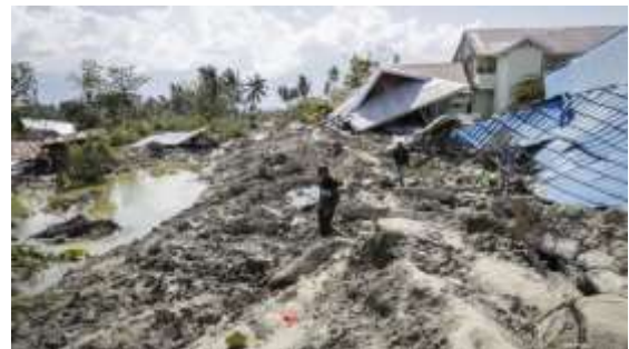
Gambar 12. Likuifaksi di wilayah Petobo yang tak kalah parahnya