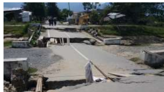
Gambar 7. Liquefaksi yang menghancurkan jalan di wilayah Sigi

Deformasi yang ditimbulkan oleh cyclic mobility umumnya terbatas dan serupa dengan perpindahan lateral.