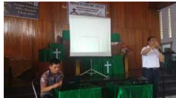
Gambar 1. Penyuluhan bangunan tahan gempa

dengan didirikannya tenda pengungsian di halaman gereja HKBP Palu yang menampung warga jemaat yang rumahnya mengalami kerusakan akibat gempa. Selain itu juga faktor ketakutan akan terjadinya likuifaksi menyebabkan warga jemaat lebih memilih untuk berada di tenda pengungsian dibandingkan dengan tinggal di dalam rumah.