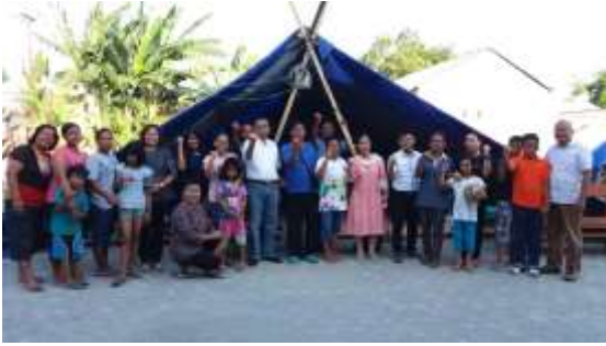
Gambar 4. Tenda pengungsian korban gempa di HKBP Palu