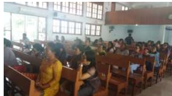
Gambar 2. Peserta Penyuluhan bangunan tahan gempa