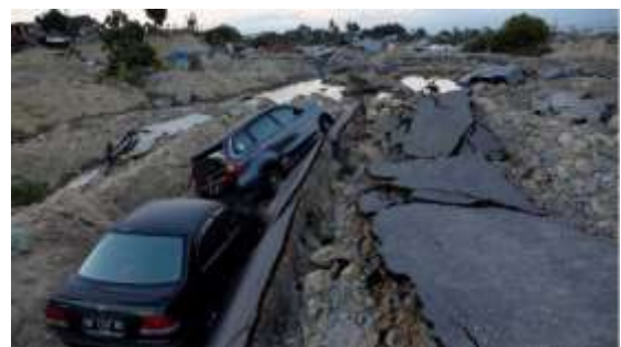
Gambar 13. Likuifaksi di wilayah Balaroa kota Palu menenggelamkan mobil