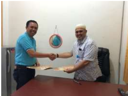
Gambar 15. Penandatanganan MoU FT UKI dengan FT UNTAD

Ucapan terimakasih kepada Dekan dan Kaprodi FT UNTAD sebagai mitra TIM PKM FT UKI selama melakukan survei dan asesmen kerusakan bangunan di Palu serta pimpinan jemaat gereja HKBP Palu yang memberikan kesempatan untuk melakukan asesmen kerusakan rumah tinggal warga jemaat pasca gempa Palu