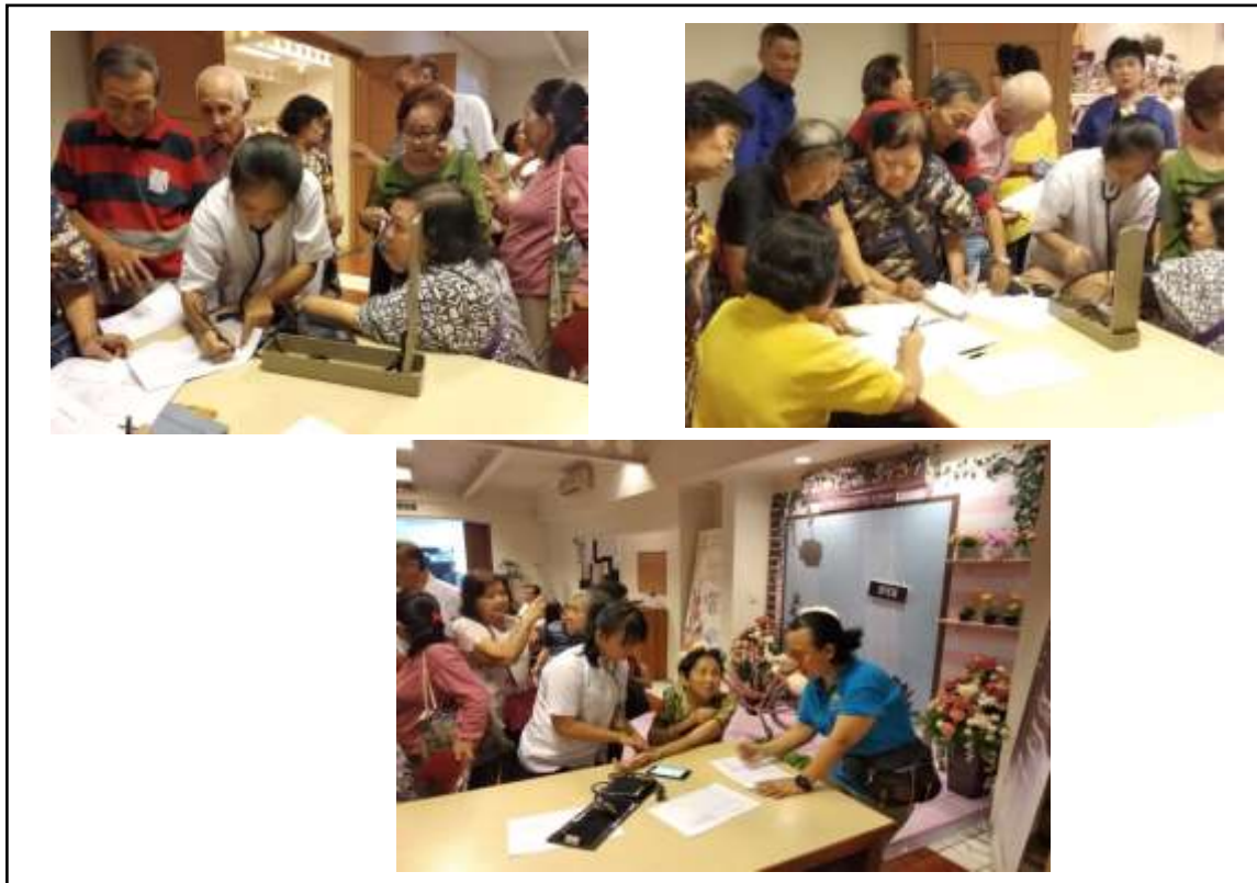
Gambar 2. Pemeriksaan Kesehatan Umum

Sesuai data yang diterima bahwa pada 23 pasien lansia yang terdiri dari 6 laki-laki dan 17 perempuan, rata-rata usia 70.9 tahun SD \pm 8.6 tahun. Hasil rata-rata tekanan darah sistole 117.39 dan diastole 77.39 serta nadi 77.57 yang menunjukkan atau masuk didalam kriteria normal. Berdasarkan data yang diperoleh, lansia yang hadir pada saat kegiatan PKM Prodi perempuan dengan kelompok umur 70-74 tahun berjumlah 2,21% dan lansia laki-laki berjumlah 1,87%. Kelompok lansia dengan usia 75+ yang berjenis kelamin perempuan 2,73% dan lansia laki-laki berjumlah 1,87%. Komposisi tahun 2018 lansia perempuan berjumlah 2.804.900 dan laki-laki berjumlah 2.012.300.