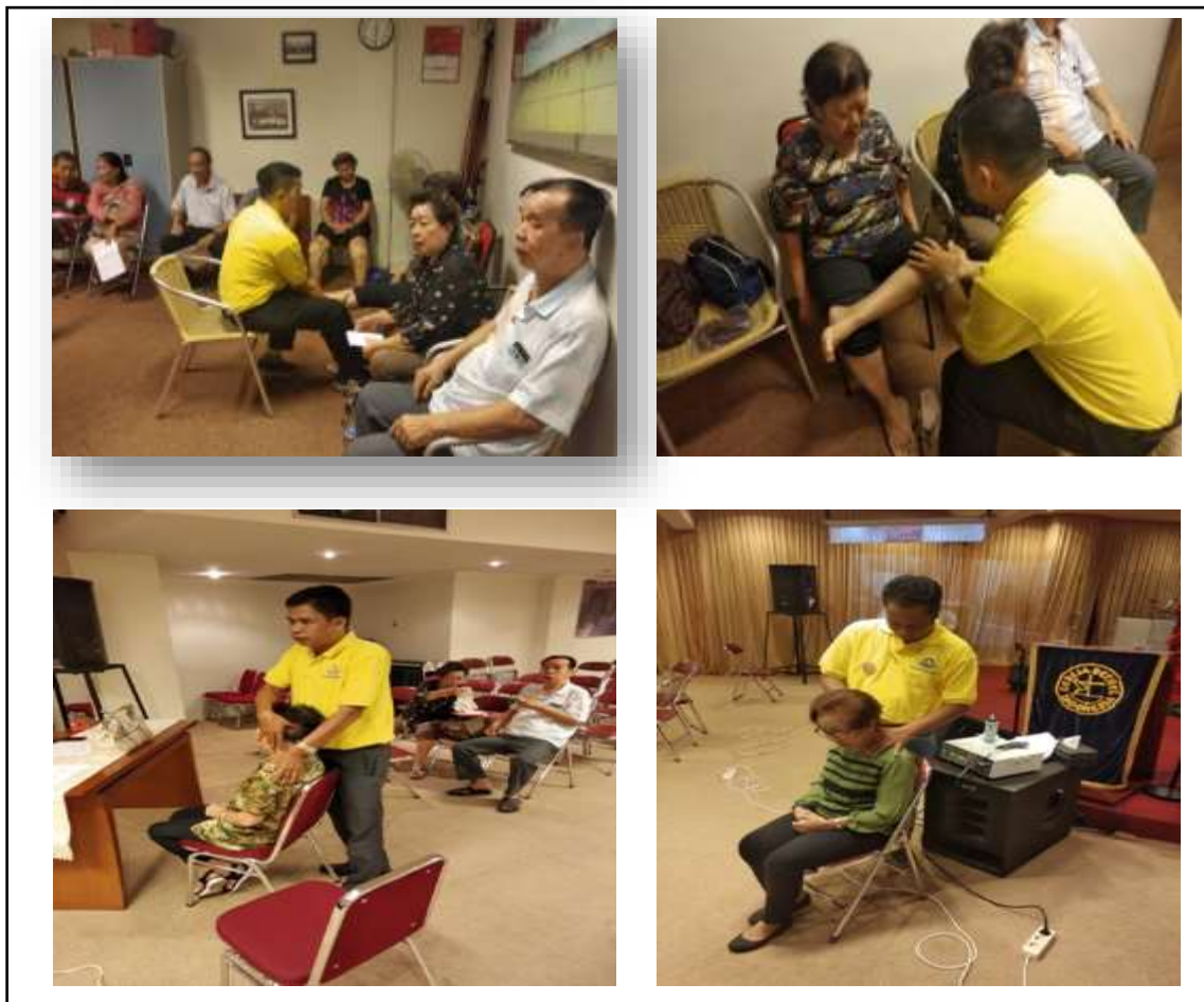
Gambar 1. Pemeriksaan dan Intervensi dari Tim Fisioterapis

dengan modalitas terapi sinar infra merah, terapi ultrasonik, terapi latihan, terapi manual, terapi pijat, terapi stimulasi elektris dan latihan di rumah. Setiap terapis menerapi satu orang.